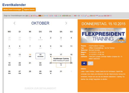
Eventkalender für Partner mit Einladefunktion

Implementierung des Eventkalenders, Eventmanagers und weiteren Funktionen wie die Anbindung eines QR Code Scanner Plugins zur Erfassung der Teilnehmer mit einer Webcam.