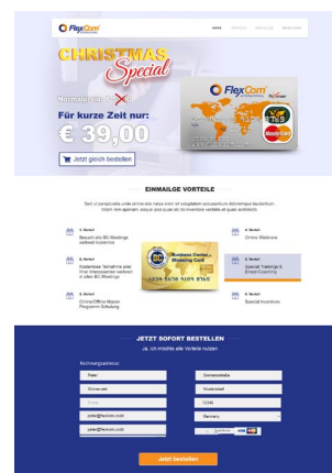
Landingpage und Bestellformular für Karten

Umsetzung der Designvorlage des Grafikers in HTML, CSS und JavaScript. Validierung der Eingabe, Integration des Micropayment und Anbindung an die Datenbank mit PHP und MySQL.